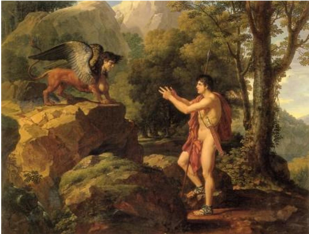
Edipo ante la Esfinge