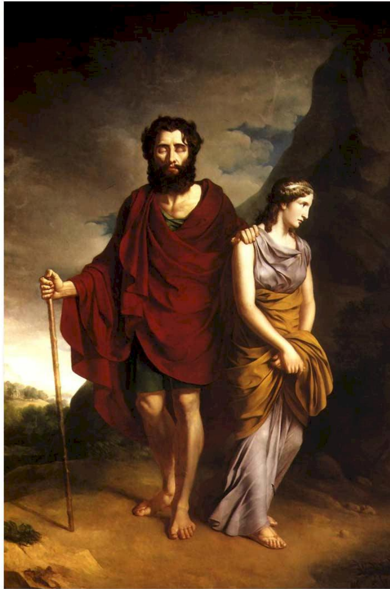
Edipo y Antígona