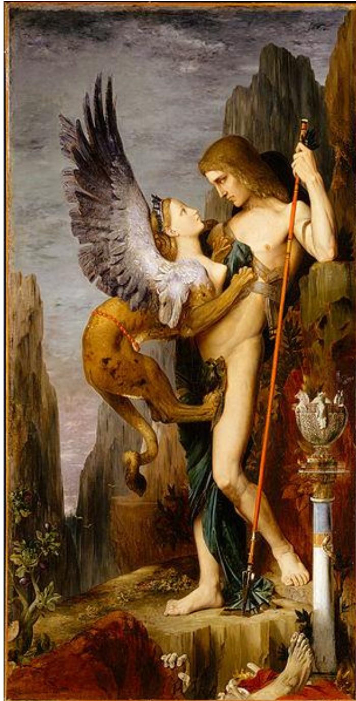
Edipo y la esfinge Gustave Moreau 1864